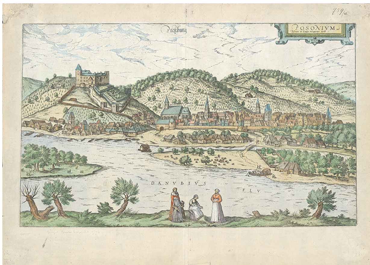
Franz Hogenberg: Pohľad na Bratislavu z juhu. Okolo roku 1588.

(Pomôžte si mapou Bratislavy na internete.)