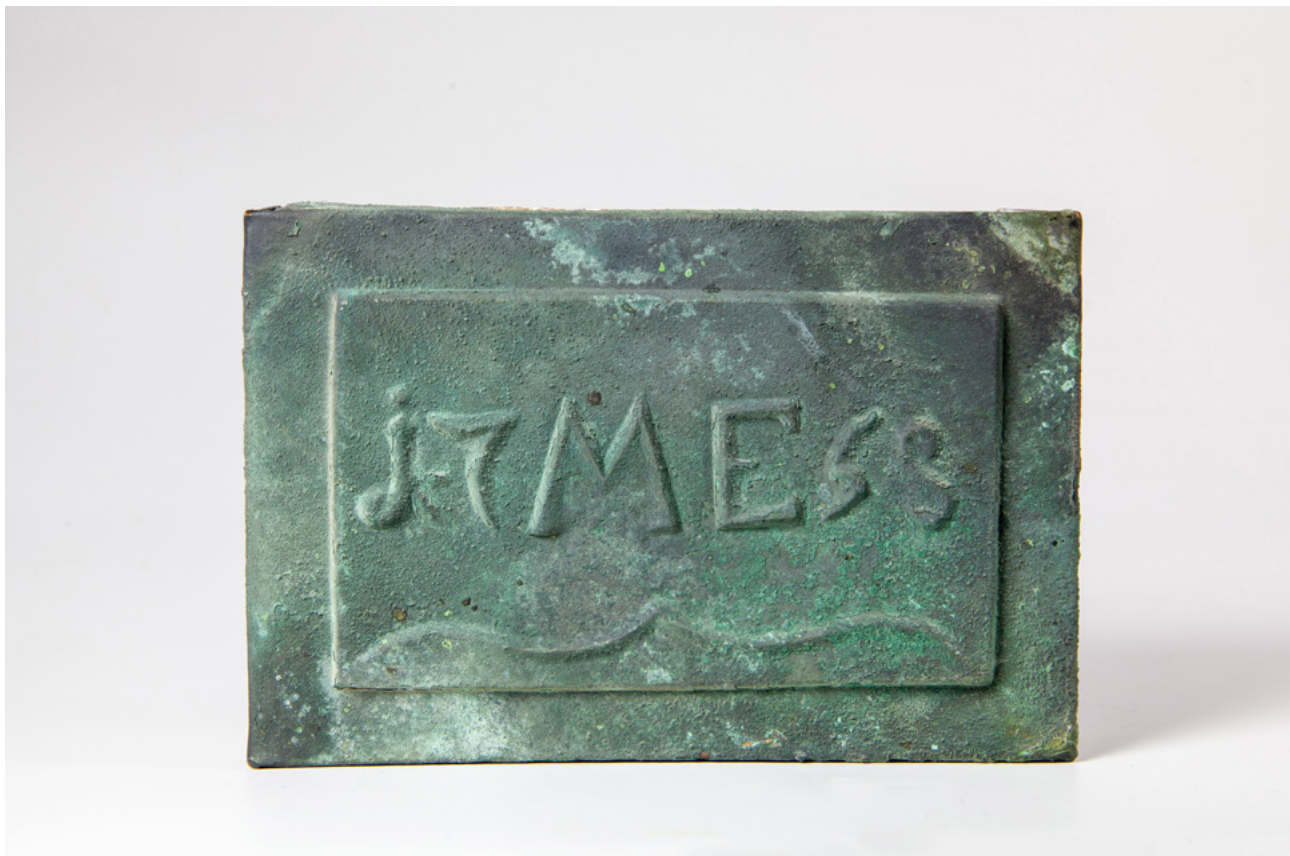
Fotografia medenej schránky nájdennej v hlave sochy archanjela Michala.

Do sochy bola vložená schránka, ktorá obsahovala údaje o úradných osobách a zhotoviteľoch sochy a veže. Pri neskorších reštaurátorských prácach k nim boli pridané aj ďalšie predmety a doklady doby.