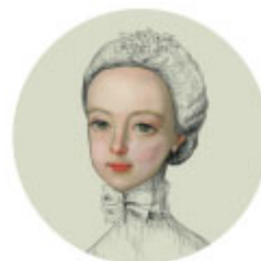
Mária Antónia (1755–1793) (37) manželka francúzskeho kráľa Ľudovíta XVI. popravená po Veľkej francúzskej revolúcii