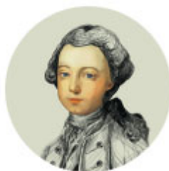
Leopold II. (1747–1792) ako panovník: (1790–1792)