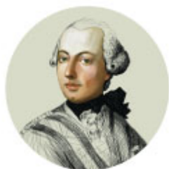
Jozef II. (1741–1790) ako panovník: (1780–1790)