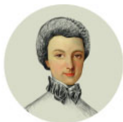
Mária Kristína (1742–1798) najoblúbenejšia dcéra